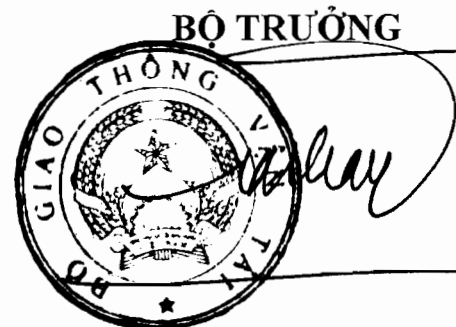
Đinh La Thăng